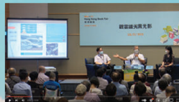
瀏覽香港書展2021作家講座：

香港氣象學會成立於1988年，致力於發展及傳播有關氣象、海洋、天文及地球物理等科學知識。推廣和提升氣象的專業應用，鼓勵對氣象有興趣的會員、個人或團體之間互相合作，推廣社會人士認識天氣，並體會氣象及其應用價值。